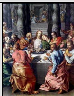
alcuni particolari restaurati