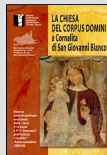
Il nostro libro che spiega la storia dell'edificio e gli affreschi

Tutti possono aiutarci a raggiungere l'obiettivo.