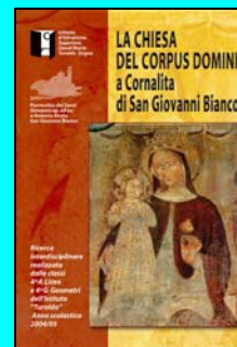
Il nostro libro che spiega la storia dell'edificio e gli affreschi

Tutti possono aiutarci a raggiungere l'obiettivo.