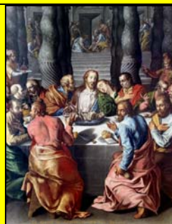
alcuni particolari restaurati